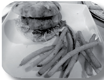
カイテンゲンゲのフィッシュ・バーガー

その上、水分も多くて、料理しにくい です。でも、食べられる物だから、すてるのは もったいないと思 います。これまで食べていなかった物を、おいしく食べられるよ うにしたいです。 これが 料理人としての仕事だと思います。」 と話していました。